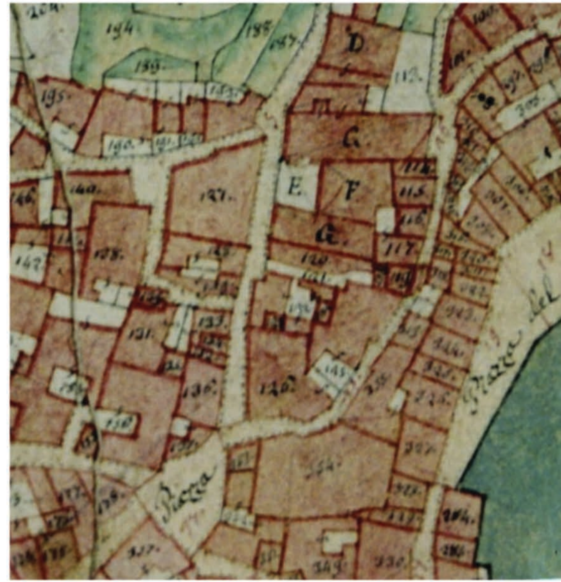
estratto catasto napoleonico (1810) scala 1:1.000