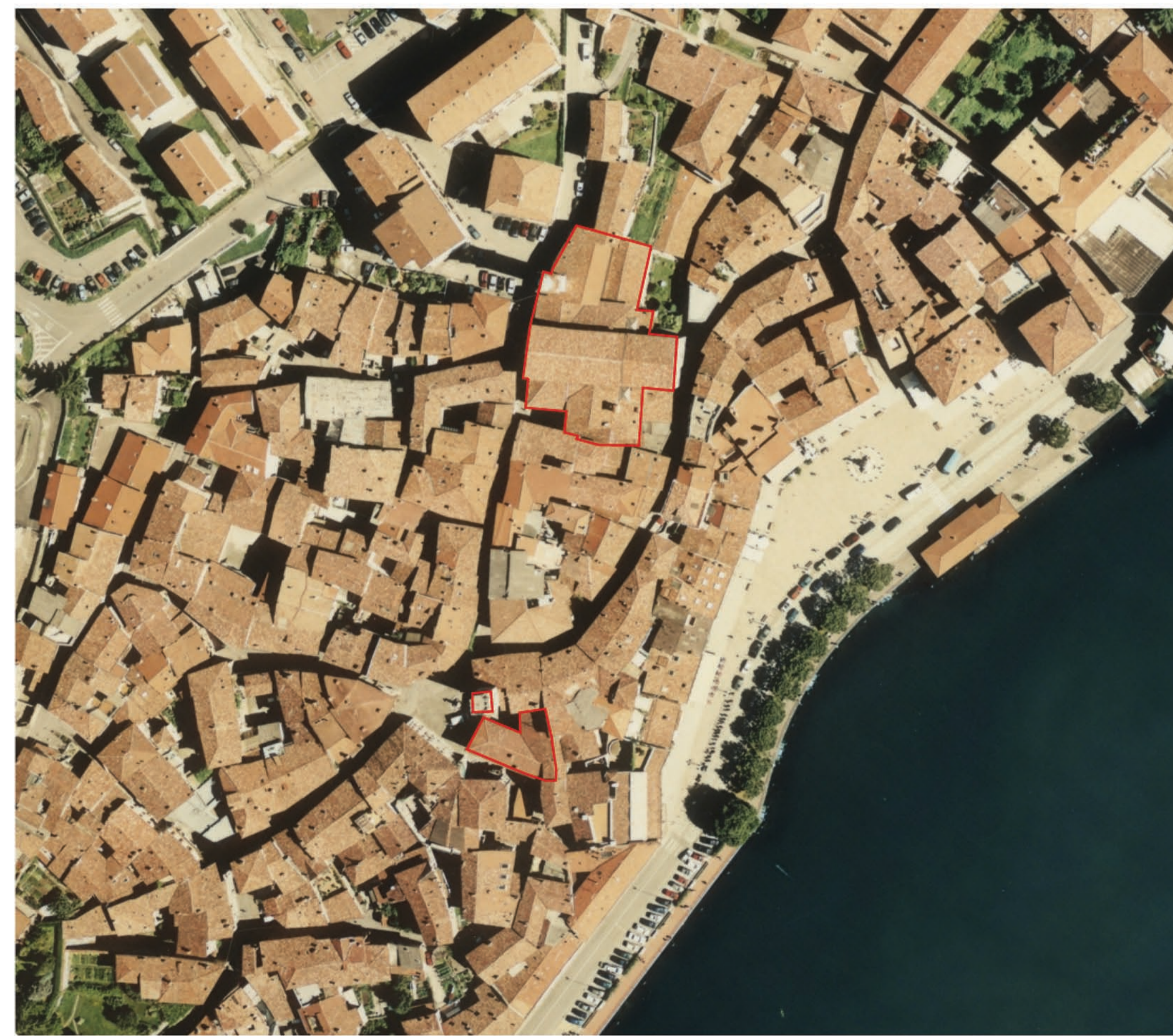
ortofoto scala 1:1.000