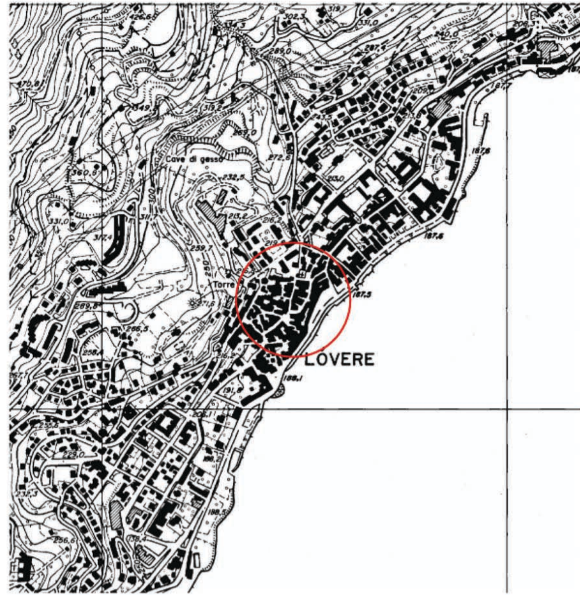
estratto carta tecnica regionale scala 1:10.000