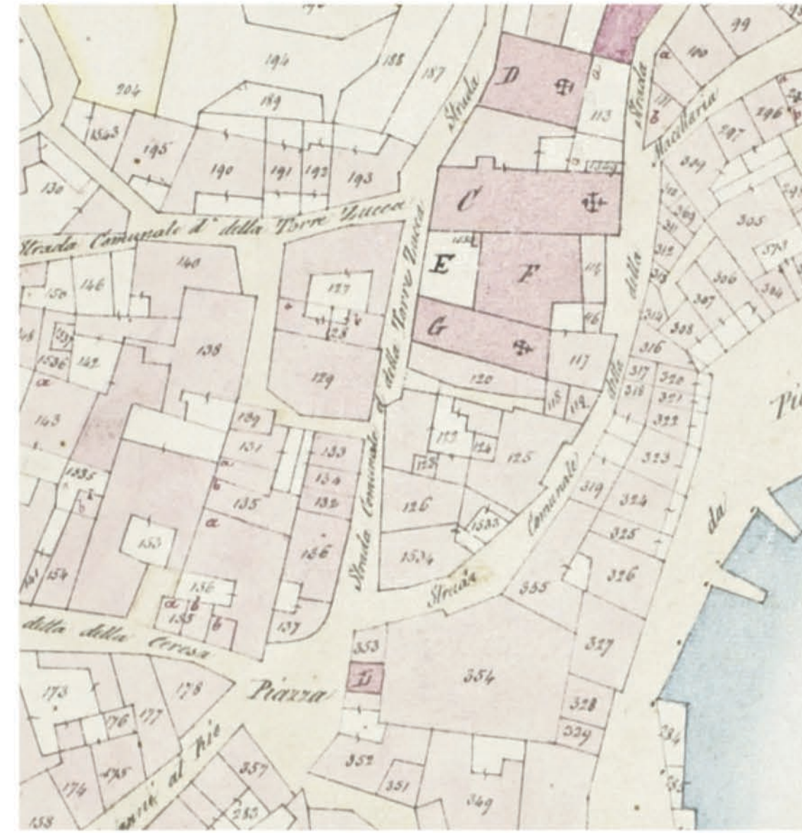
estratto catasto lombardo-veneto (1853) scala 1:1.000