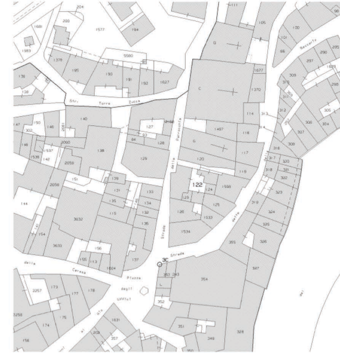
estratto mappa catastale scala 1:1.000