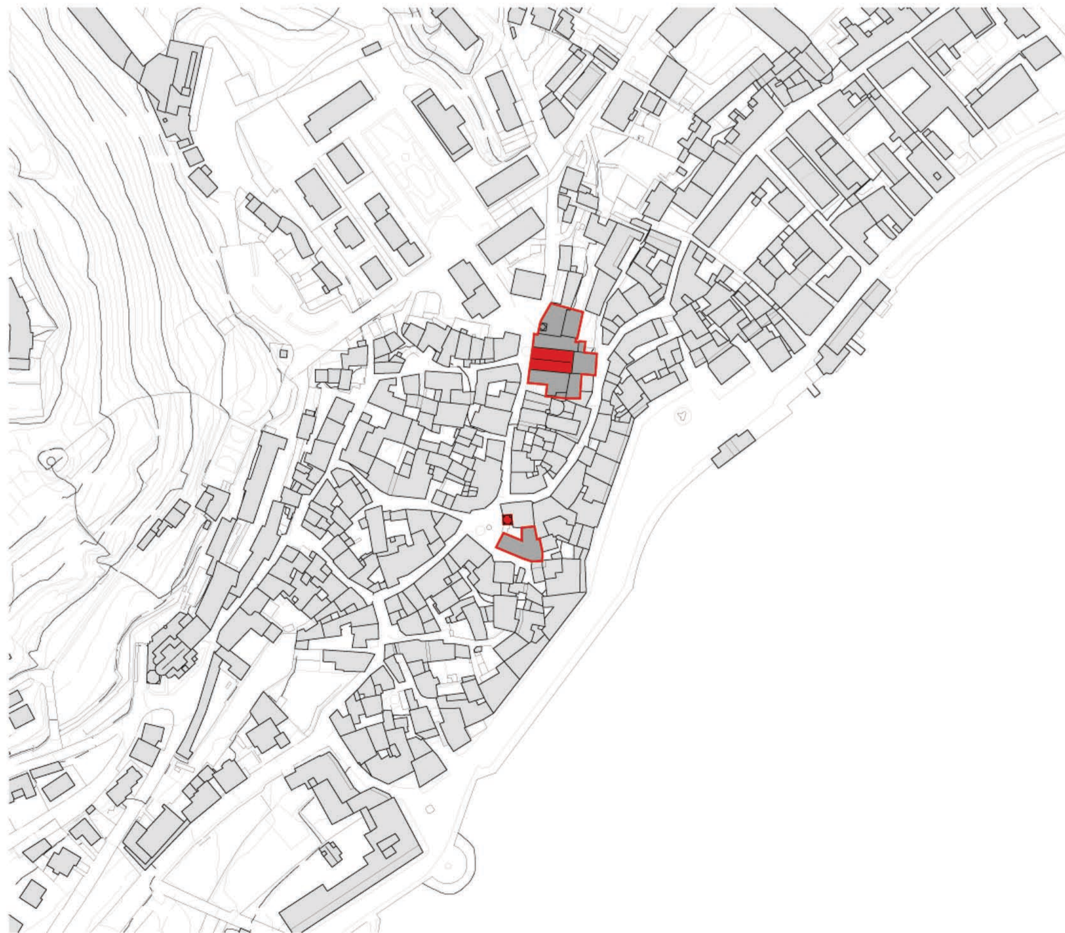
estratto rilievo aerofotogrammetrico scala 1:2.000