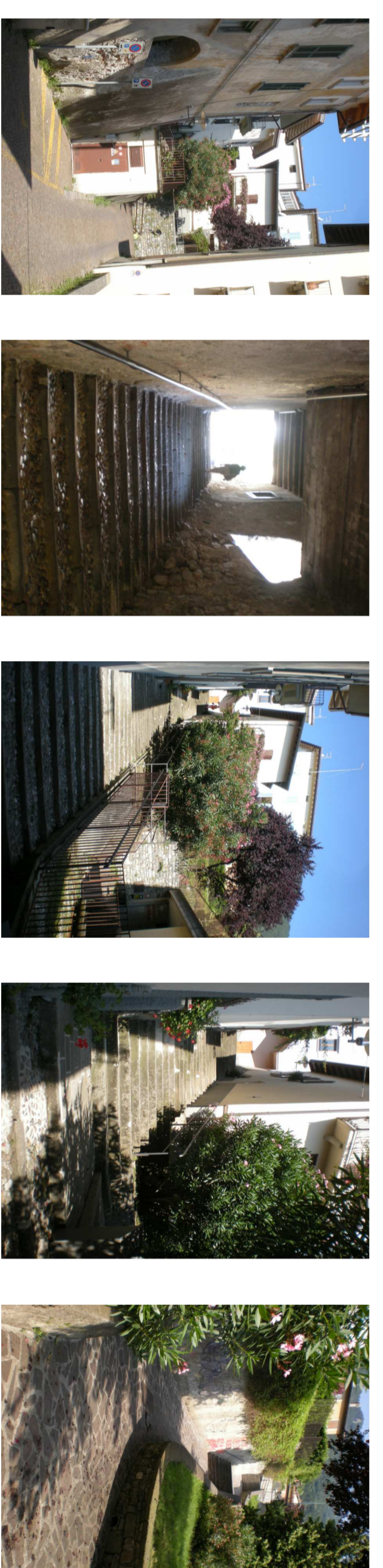
V01 vista della scalinata da vicolo Fossa