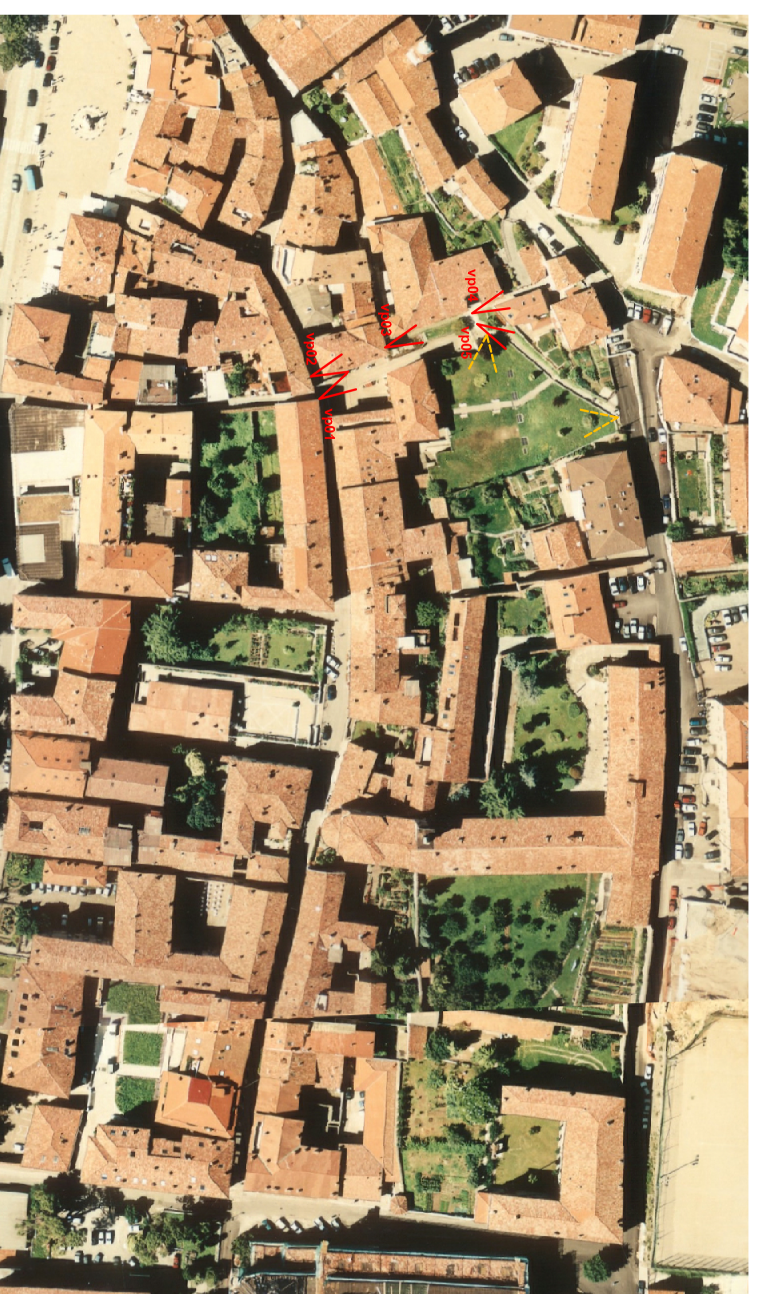
ortofoto scala 1:1.000