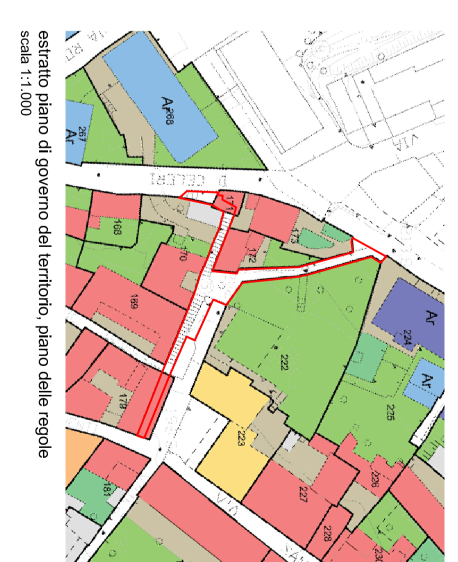
estratto piano di governo del territorio, piano delle regole scala 1:1.000